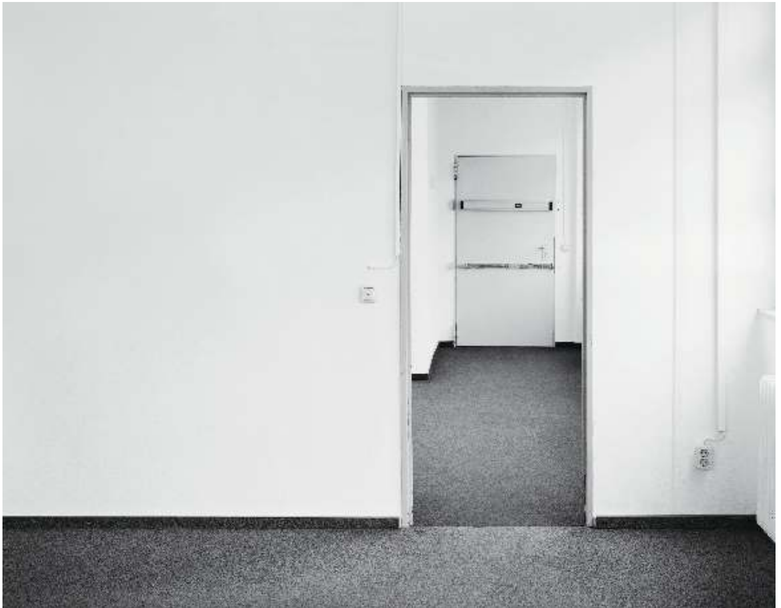
Atelier (Raum 2.1), 2009 Gelatine-Silberdruck / Gelatin silver print 30,5 x 38,5 cm