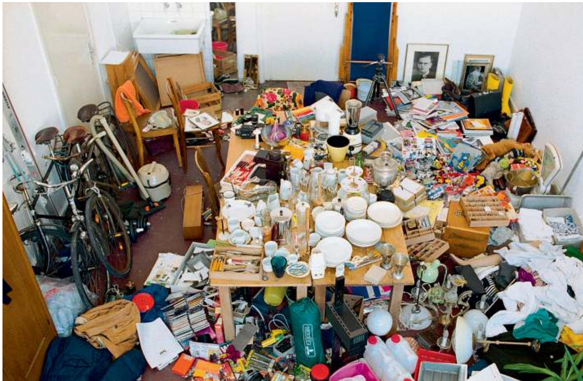
Gesamtbesitz, 1996 Installationsansicht / Installation view HfBK Hamburg