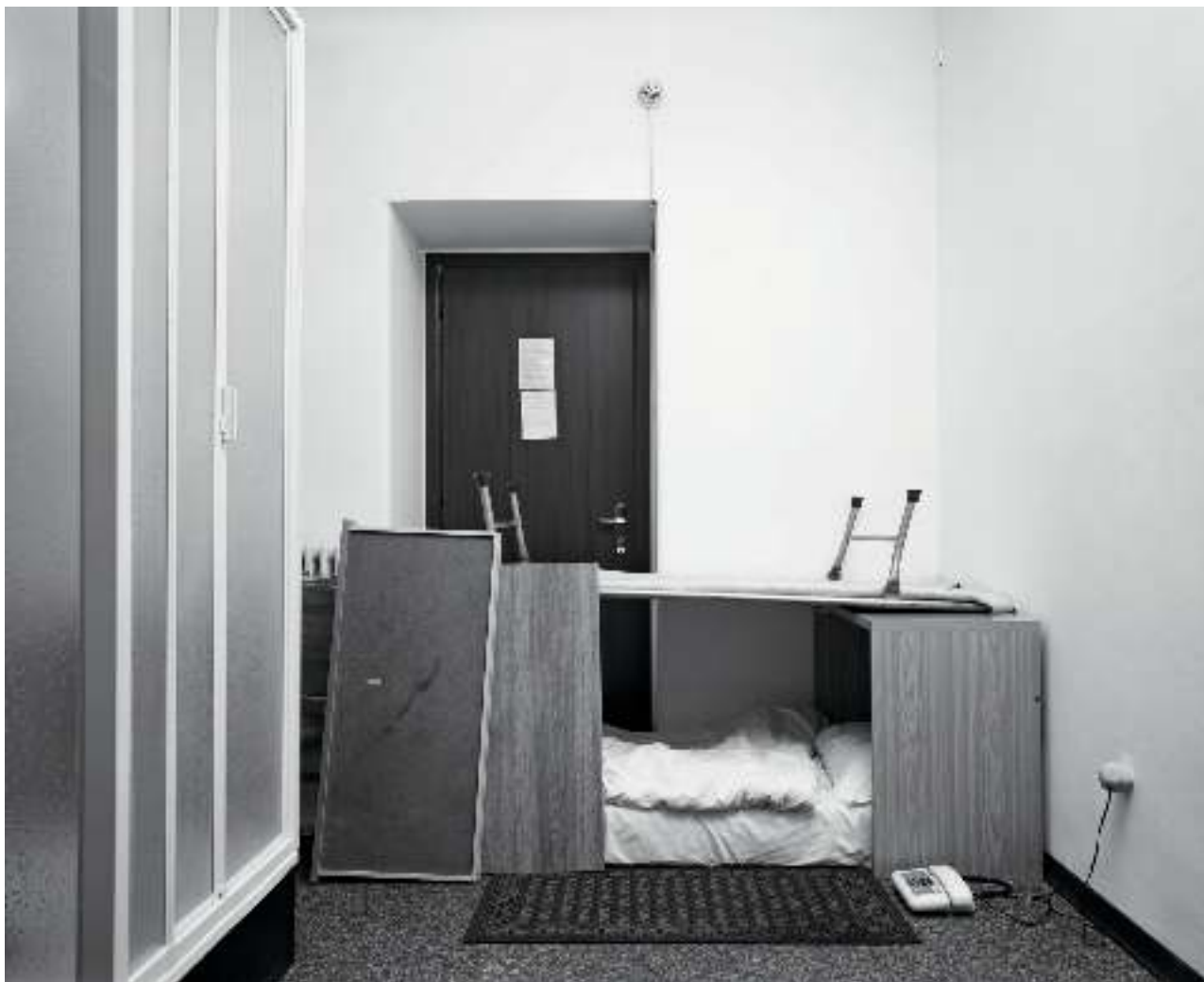
Hotel Citta di Parenzo, Triest, Zimmer 307, Nacht zum 2. Januar 1999 Gelatine-Silberdruck / Gelatin silver print 20.5x26 cm