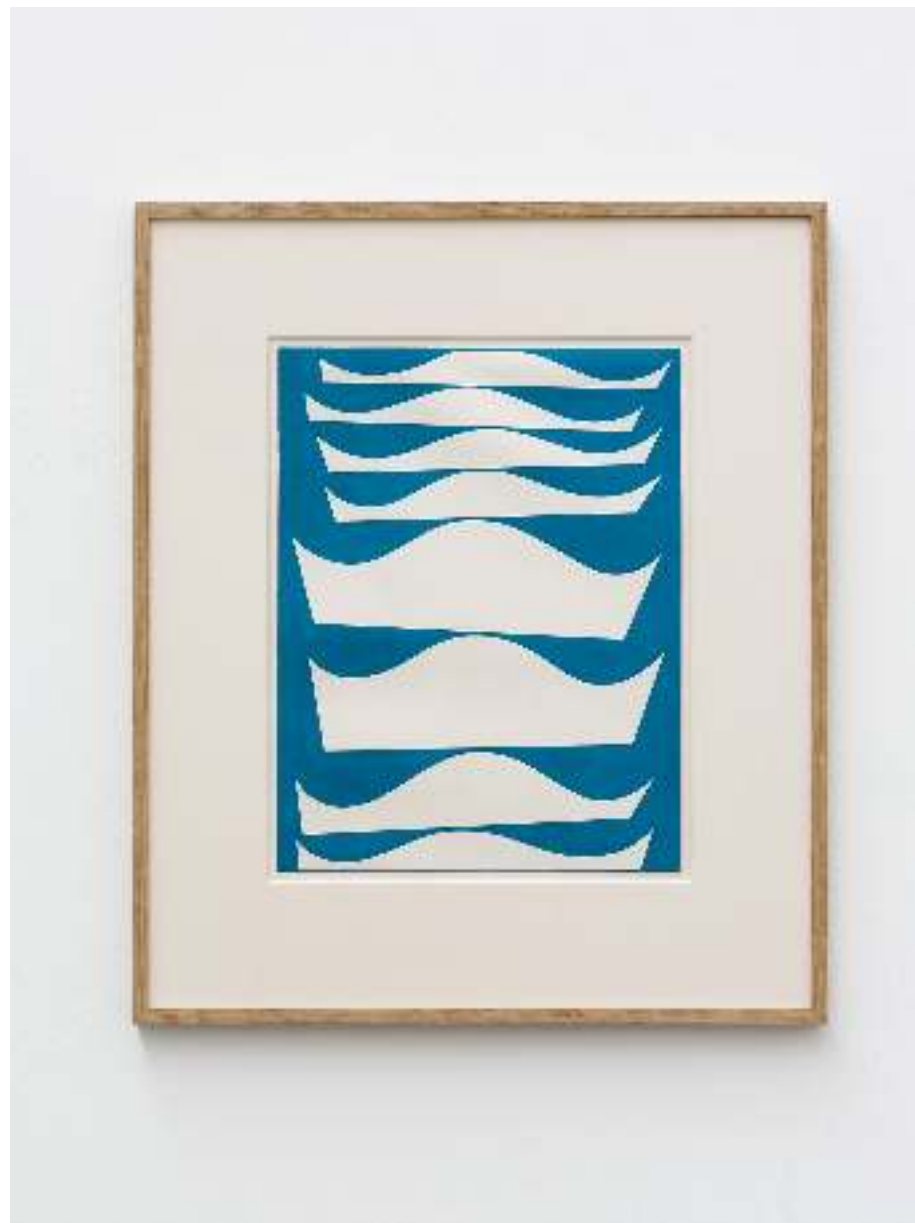
Theo van Doesburg, Sophie Taeuber-Arp, Hans Arp, ca. 1926/1928